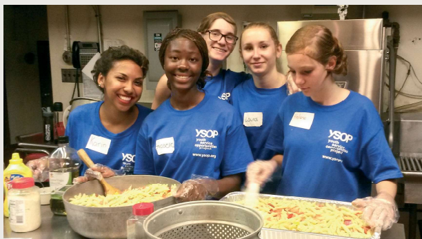
En 2014, des jeunes préparent un repas pour les sans-abri

Pour réduire le coût du voyage et éviter une «sélection par l'argent» qui permettrait seulement aux jeunes des familles favorisées de partir, des actions seront menées lors des prochains mois.