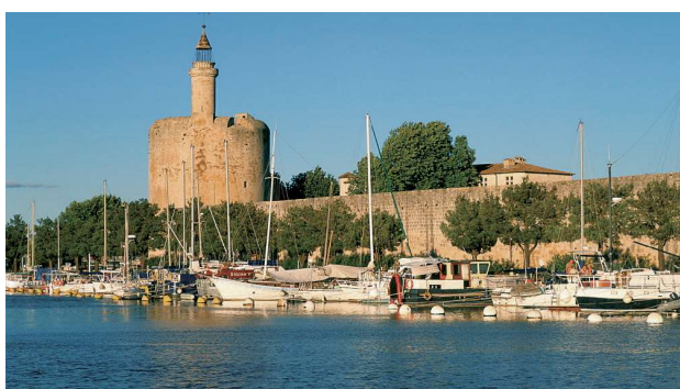
La Tour de Constance à Aigues-Mortes

Les 2 événements les plus importants de ce séjour seront : - La Visite de La Tour de Constance : située dans la cité médiévale d'Aigues-Mortes, elle est réputée pour avoir