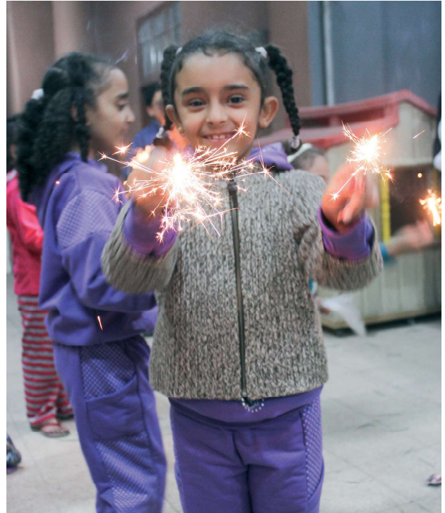
Fillettes à l'orphelinat protestant du Caire

Que dire de Saint Bichoï , et de Saint Macaire , monastères des Pères du désert du IV e s., ces superbes murs impressionnants ne se vantent pas d'avoir vu passer le Christ, ils rayonnent, ils témoignent, c'est tout. Ils sont preuves belles et solides que quelque chose de